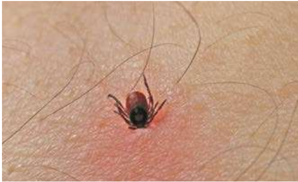
Teken bijten zich vast in de huid.

Teken zijn kleine beestjes. Ze zitten in het groen: vooral in het bos, de duinen, maar ook in het park en in de tuin. Teken zitten vaak in hoog gras en struiken. Teken kruipen op dieren of mensen en bijten zich vast om bloed op te zuigen. Teken bijten vooral in het voorjaar, de zomer en de herfst. Mensen die veel in de natuur zijn en kinderen die buiten spelen hebben vaker tekenbeten.